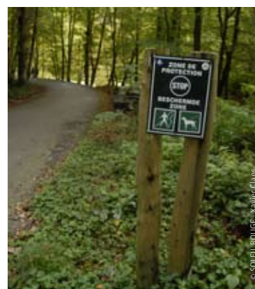
Hou in het woud steeds rekening met de aanduidingen

In al deze gebieden moeten de wandelaars op de paden blijven en hun honden aan de leiband houden (Ordonnantie van 30 maart 1995).