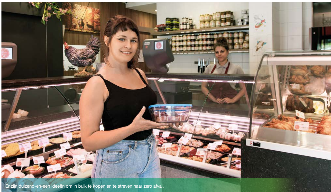
Er zijn duizend-en-een ideeën om in bulk te kopen en te streven naar zero afval.

U hebt een winkel of een horecabedrijf en ook u bent op zoek naar oplossingen om uw verpakkingsafval te verminderen en zo tegemoet te komen aan de groeiende vraag van de Brusselaars naar een activiteit met zero afval? Laat u inspireren door de oplossingen die werden gekozen door een van de twaalf winnaars van de projectoproep 'Zero Afval Horeca en Voedingszaken', die in december 2018 werd gelanceerd door Leefmilieu Brussel.