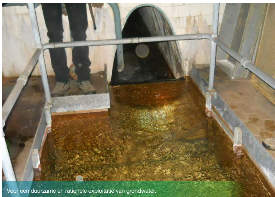
Voor een duurzame en rationele exploitatie van grondwater.

De hoofddoelstelling was om tegelijkertijd een administratieve vereenvoudiging van de procedures voor te stellen en een juridische modernisering door te voeren.