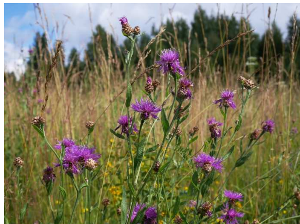
CC – Chelo Vechek