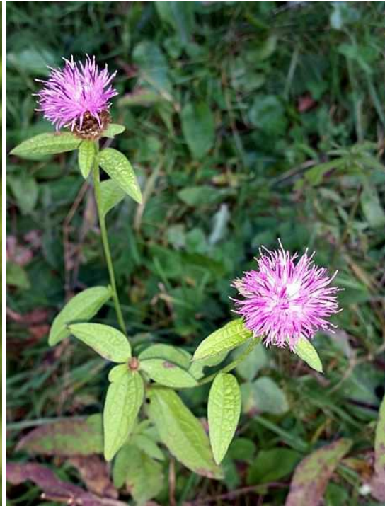
Centaurea nigra