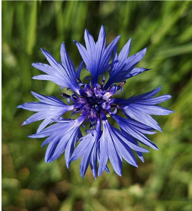
Centaurea cyanus (CC- Ritadesbois)