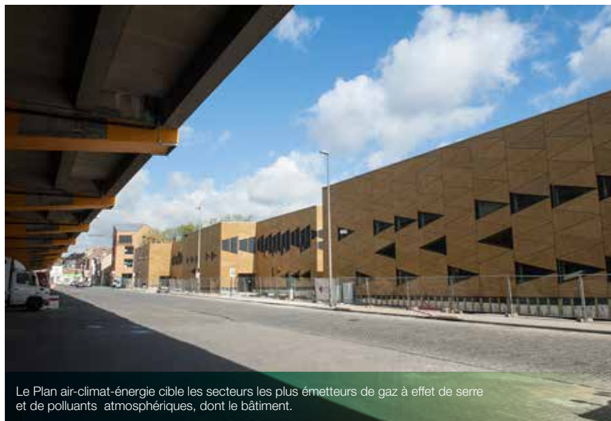
Le Plan air-climat-énergie cible les secteurs les plus émetteurs de gaz à effet de serre et de polluants atmosphériques, dont le bâtiment.

Pour limiter les émissions des polluants les plus nocifs (dioxyde d'azote et particules très fines de « black carbon ») et enfin remédier au problème de la mauvaise qualité de l'air et de ses conséquences en termes de santé, la Région a aussi prévu de mettre en place, dès 2018, une zone de basses émissions sur tout le territoire régional. Cette mesure, très attendue, a largement fait ses preuves dans d'autres capitales européennes, comme Londres ou Stockholm (à ce jour, environ 194