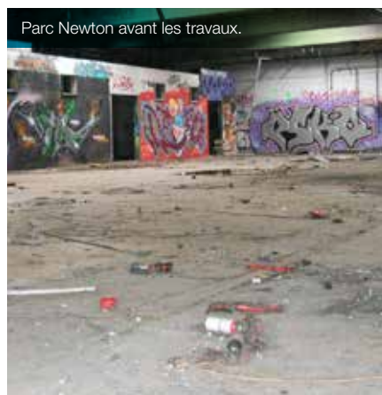
Parc Newton avant les travaux.

Grâce aux entreprises installées, le parc Newton vise à créer des emplois en lien avec le profil socio-économique des habitants de la zone d'intervention prioritaire. Par ailleurs, les fonds FEDER, dont le projet a bénéficié, visent également à développer l'emploi peu