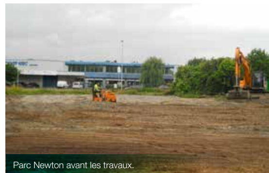
Parc Newton avant les travaux.

Héritière d'un riche passé industriel, la Région de Bruxelles-Capitale comprend nombre de parcelles polluées. L'inventaire de l'état du sol finalisé par Bruxelles Environnement fin 2015 compte actuellement 14 193 parcelles dont 1 039 sont propres, 9 091 potentiellement polluées, 2 870 polluées et 1 193 légèrement polluées.