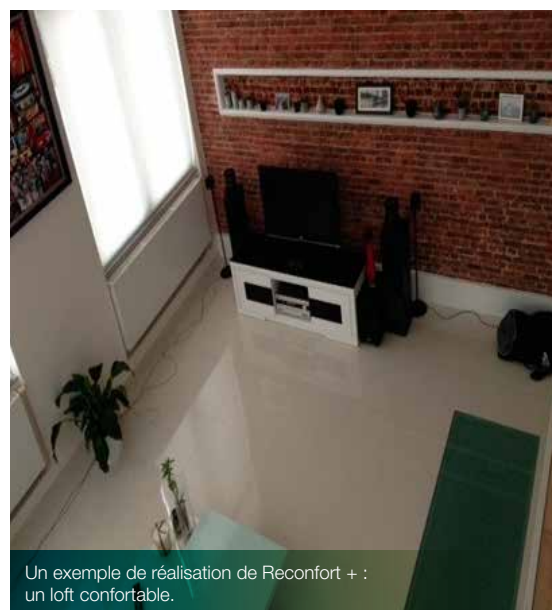
Un exemple de réalisation de Réconfort + : un loft confortable.

Le statut de coopérative permet aux travailleurs-coopérateurs d'affecter d'éventuels bénéfices en investissements, pour acquérir du matériel moderne et écologique ou pour valoriser les ressources humaines par le financement de formations continues, spécialisées dans les domaines de la construction et de la rénovation. Pour remplir cet objectif, Réconfort + a bénéficié de subventions de la Région de Bruxelles-Capitale. Considérée comme pilote, l'entreprise a également bénéficié d'une éco-bourse pour sa création, ce qui lui a permis de réaliser ses premiers investissements.