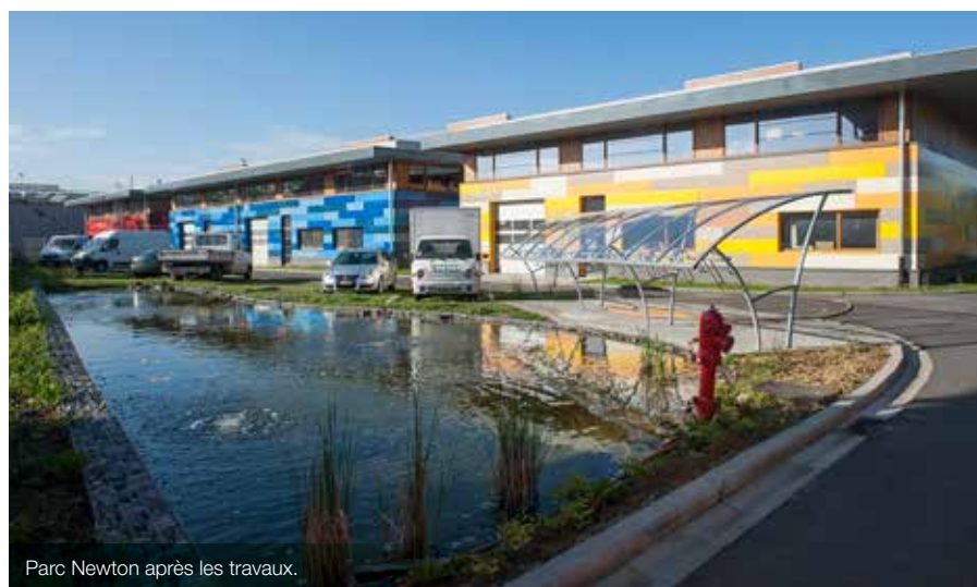
Parc Newton après les travaux.

Ce projet s'inscrit dans plusieurs objectifs spécifiques puisqu'il favorise, d'une part, le maintien d'acteurs économiques déjà présents dans la zone et qu'il soutient, d'autre part, les projets de relocalisation d'activités anciennement délocalisées.