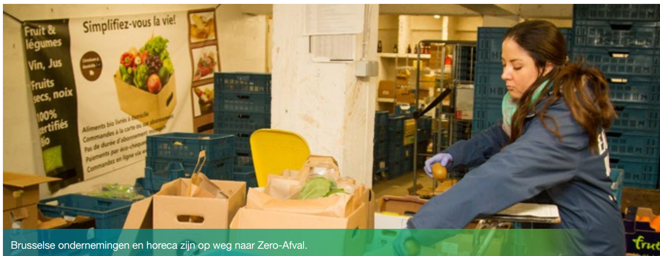
Brusselse ondernemingen en horeca zijn op weg naar Zero-Afval.

Bulk, herbruikbare verpakkingen, statiegeld ... Op aandringen van steeds meer klanten verovert de zero afval-gedachte de voedingswinkels en de horeca in Brussel. Ondanks de onzekere context van de gezondheids crisis hebben 51 bedrijven zich ingeschreven voor de 2de editie van de projectoproep 'Zero Afval Horeca en Voedingszaken'. Dat cijfer evenaart bijna dat van de vorige editie en bewijst de proactiviteit van de sector! Ontdek de inspirerende projecten van de 19 ondernemingen die in 2020 geselecteerd werden.