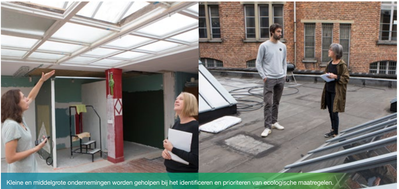
Kleine en middelgrote ondernemingen worden geholpen bij het identificeren en prioriteren van ecologische maatregelen.

Ontdek meer getuigenissen op www.packenergie.brussels