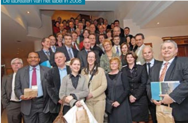
De laureaten van het label in 2008